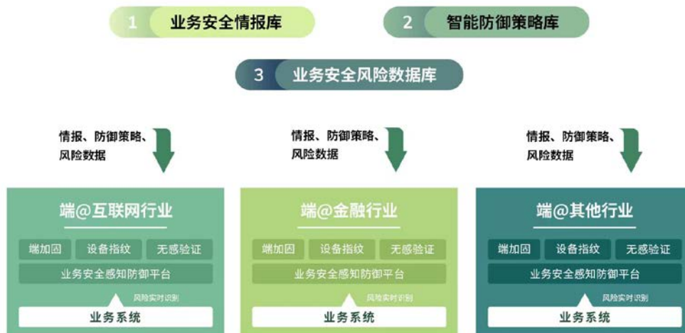
图 2 业务安全云架构体系